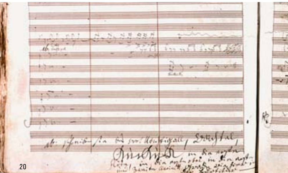
Autograph der „Pastorale“, Ausschnitt vom Ende des 2. Satzes („Szene am Bach“) mit Beethovens Vermerk: „Schreiben sie das Wort Nachtigall [...] in die erste Oboe [...]“

(Ludwig van Beethoven, Skizzenheft 1815)