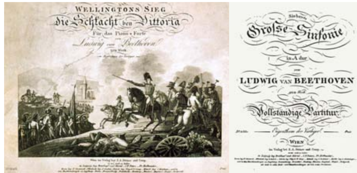
„Wellingtons Sieg oder Die Schlacht bei Vittoria“ op. 91, Titelseite der Klavierausgabe (1816)