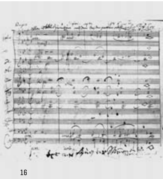
Beethovens Vierte Sinfonie B-Dur op. 60, eigenhändige Niederschrift der Partitur

Gegensatzpaar exponiert, mit dessen Vermittlung das Werk schließlich in gelöster Stimmung endet. 1844 schrieb Hector Berlioz über das Werk: „Hier verlässt Beethoven Ode und Elegie vollständig, um zu dem weniger erhabenen und weniger düsteren, aber vielleicht nicht weniger schwierigen Stile der zweiten Symphonie zurückzukehren. Der Charakter der Partitur ist im allgemeinen lebhaft, frisch, heiter oder von himmlischer Zartheit.“