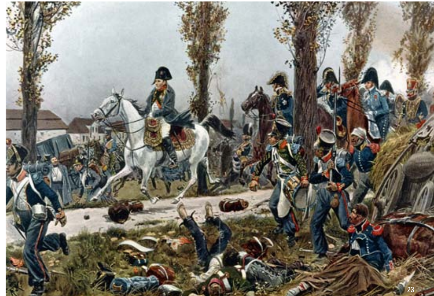
Napoleons Flucht am 19. Oktober 1813 nach der Niederlage in der Völkerschlacht bei Leipzig, Aquarell von Richard Knötel (1857-1914)

Die starke Wirkung, die Beethovens „antinapoleonische“ Musiken im Publikum auslösten (bekanntlich war die einstige Begeisterung des Komponisten für den „grand' Uomo“ aus Korsika in Ablehnung umgeschlagen), ist beispielhaft in einem Bericht über eine spätere Aufführung vom 27. Februar 1814 dokumentiert: „Wer sich eine Versammlung von 5000 Zuhörern mit erhobener Stimmung in Folge aus vorhergegangener welterschütternder Ereignisse auf den Schlachtfeldern Leipzig's und