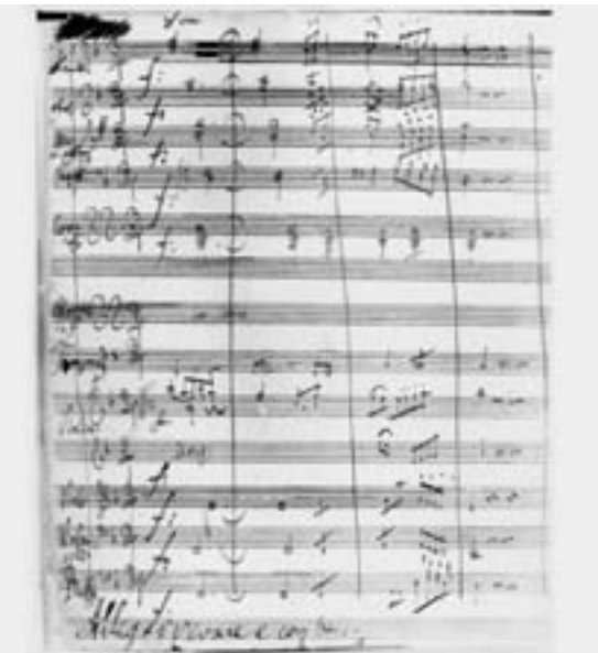
Achte Sinfonie, erste Seite des Manuskripts (1812)