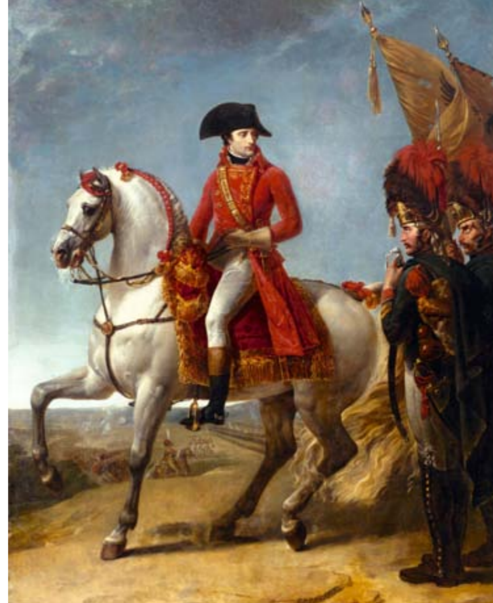
Reiterbildnis Napoleon Bonapartes als Erster Konsul, Gemälde von Antoine-Jean Gros (1803)

Obgleich die Zweite Sinfonie einen gewaltigen Schritt in Richtung „Ideen-Kunstwerk“ darstellt, mit welchem Beethoven seinem erklärten Ziel, „poetische Ideen“ in Musik zu setzen (wie etwa die Frage nach der individuellen Freiheit und Selbstbestimmung des Menschen), einen großen Schritt näher gekommen war, entschied sich der Komponist bei seiner Dritten für einen „neuen Weg“, da er – laut den Erinnerungen seines Schülers Carl Czerny – mit seinen bisherigen Arbeiten „nur wenig zufrieden“ war. Insofern überrascht es nicht, dass sich die „Eroica“ weiter als die bisherigen Sinfonien Beethovens von den Gattungskonventionen entfernt, weshalb ein Rezensent das Werk auch als eine „sehr weit ausgeführte, kühne und wilde Phantasie“ bezeichnete.