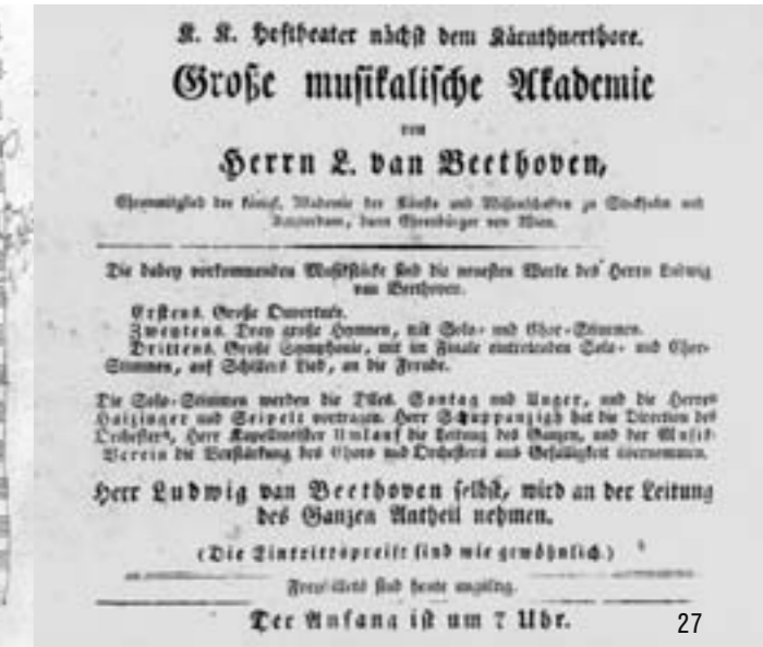
Ansclagzettel für das Konzert am 7. Mai 1824 im Wiener Kärntnertortheater mit der Uraufführung der Neunten Sinfonie

„Solche classische Werke zu beurtheilen [wie die Achte Sinfonie], sind die schönsten Momente in dem übrigens nicht sonderlich erfreulichen Leben eines kritischen Recensenten; mit Herzenslust schreitet er zu Werke; jeden Augenblick entdeckt er neue Schönheiten, jede Seite beynahe liefert ihm neue Beweise von den hohen Talenten dieses Amphion unserer Zeit, und erfüllt ihn mit tiefer, unbegrenzter Verehrung; er schwelgt beim Eyndringen ins Heiligthum, und ein erhöhter Wiedergenuß wird ihm zu Theil, indem er den Schleyer lüftet, und es ihm vergönnt ist, die Blicke der Welt auf eine Riesenarbeit zu leiten, die – der Stolz der Gegenwart – das Erstaunen und den Neid unserer Nachkommen erwecken muss, die, nicht geboren – erschaffen ward, und – gleich Minerven – nur dem Gehirne eines Gottes entspringen konnte.“ („Allgemeine Musikalische Zeitung“, 1818)