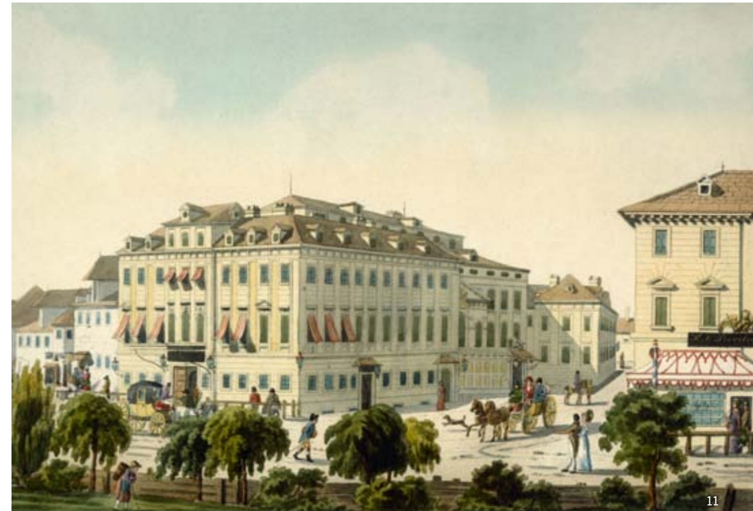
Theater an der Wien, kolorierte Radierung von Laurens Janscha (um 1810); hier wurden Beethovens Zweite, Dritte, Fünfte und Sechste Sinfonie uraufgeführt

Wie ungewohnt die zeitgenössischen Hörer die Instrumentation des Werkes empfunden haben müssen, geht aus einem Bericht der Leipziger „Allgemeinen Musikalischen Zeitung“ hervor, in dem bemängelt wurde: „[...] nur waren die Blasinstrumente gar zu viel angewendet, so daß sie mehr Harmonie, als ganze Orchestermusik war.“ Tatsächlich hat Beethoven den Bläsern (der „Harmoniemusik“) ungewohnte Aufgaben zugewiesen – schließlich bedeutete Instrumentation für ihn nicht nur das Verteilen des melodischen Grundmaterials auf verschiedene Instrumente, sondern auch das Erzeugen von Mixturklängen, durch die das Material unterschiedlich eingefärbt und schattiert wird. Insofern drückte sich ein Rezensent nur ungenau aus, als er