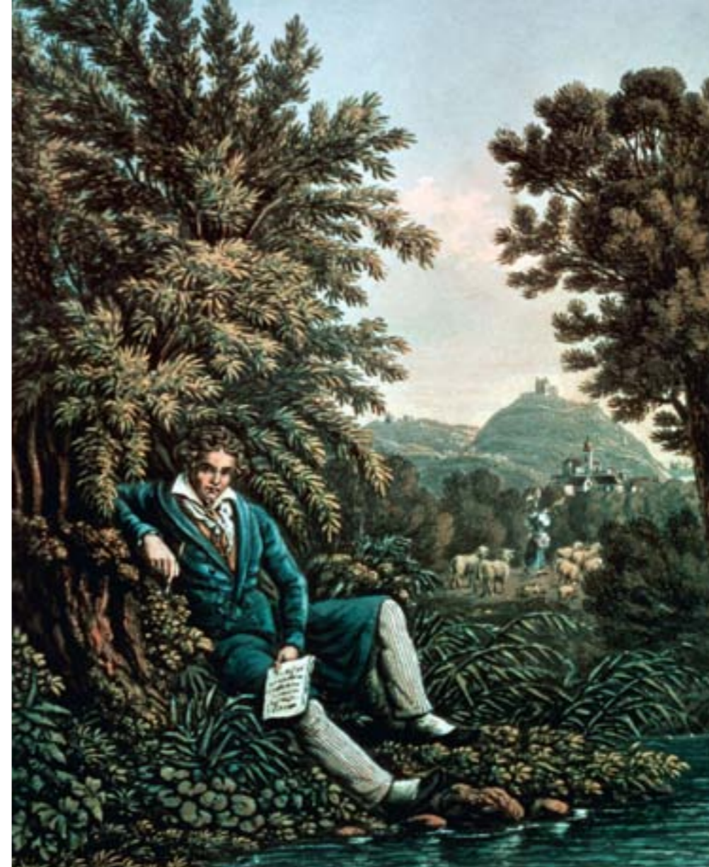
„Beethoven am Bache, die Pastorale komponierend“, Farblithographie aus dem Almanach der Musikgesellschaft Zürich (1834)

Bei der Darstellung des zunächst fernen, dann langsam näher kommenden Donnerrollens begnügte sich Beethoven im übrigen nicht mit crescendoerendem „Paukengerassel“, wie es der Musiktheoretiker Abbé Vogler in seinen „Betrachtungen der Mannheimer Tonschule“ für eine Gewittermusik forderte, sondern ging