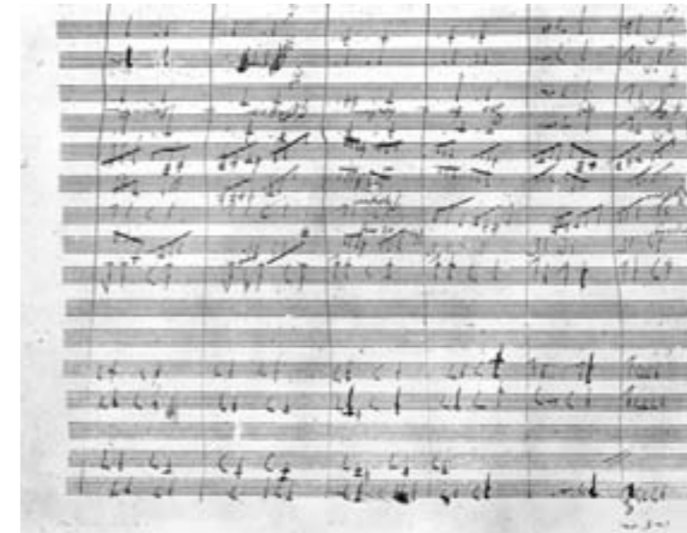
Handschriftliche Skizze Beethovens zu der „Ode an die Freude“

Überlieferung in dieser Form wohl nicht mit den historischen Tatsachen übereinstimmt, geht man heute davon aus, dass die Geschichte nicht gänzlich aus der Luft gegriffen ist.) Den dritten Satz bezeichnete Beethoven distanzierend als „Tempo di Menuetto“ (statt einfach „Menuett“) – als wolle er zum Ausdruck bringen, dass der höfische Tanz im Jahr 1812 nicht mehr ungebrochen zur Anwendung kommen könne. Und das Finale mit seinen schnell wechselnden Gedanken empfand Louis Spohr, als ob jemand einem mitten im Gespräch die Zunge herausstreckte – musikalisch ausgedrückt: die geradezu übertrieben wirkende Durchführungsarbeit bleibt ohne jede Konsequenz, da sich eine befreiende Finalwirkung nicht recht einstellen will. In diesem