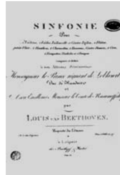
Fünfte Sinfonie, Titelblatt der Erstausgabe (1809)

und Flautino [besetzt] – zwar nur 3 Pauken, wird aber mehr Lärm als 6 Pauken und zwar besseren Lärm machen.“ Darüber hinaus finden sich in dem Werk viele thematische Bezüge zur Musik der französischen Revolution, weshalb schon Schumann auf die Ähnlichkeit mit der zeitgleich entstandenen Ersten Sinfonie g-moll von Étienne-Nicolas Méhul hingewiesen hat – ein Werk, das im „Magazin de Musique“, einer Art Staatsverlag für die offiziellen Festmusiken der Revolution, erschienen war. Der Finalbeginn von Beethovens Fünfter verweist auf einen Freiheitschor von François Joseph Gossec (neben Méhul der berühmteste Komponist der Revolution) aus dem Jahr 1792 sowie auf eine Siegeshymne von Jean-Baptiste Lacombe und Martin Joseph Adrien, die Beethoven schon früher, u. a. im Hauptthemennachsatz des Kopfsatzes seiner Ersten Sinfonie, verwendet hatte. Weiterhin scheint das berühmte Klopfmotiv des ersten Satzes Luigi Cherubinis „Hymne du Panthéon“ entnommen zu sein. Die entsprechende Stelle aus dem Chor, der 1792 als offizielle Musik der französischen Revolution aufgeführt worden war, handelt von dem Schwur, für Republik und Menschenrechte zu sterben. Peter Gülke hat darüber hinaus festgestellt, dass die prägnante Folge zweier verschränkt fallender Terzen, die im Thema des ersten Satzes anzutreffen ist, der „Hymne an die Vernunft“ entstammt, die vom Verfasser der „Marseillaise“,