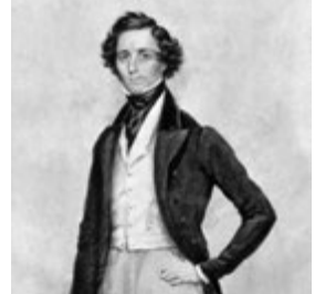
Felix Mendelssohn Bartholdy (Aquarell von James Warren Childe, 1829)