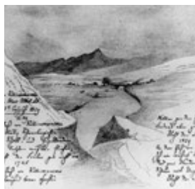
Blatt aus dem von Mendelssohn während seiner schottischen Reise geführten Zeichen- und Tagebuch (3. August 1829)

Sinfonie Nr. 3 a-Moll op. 56 „Schottische“