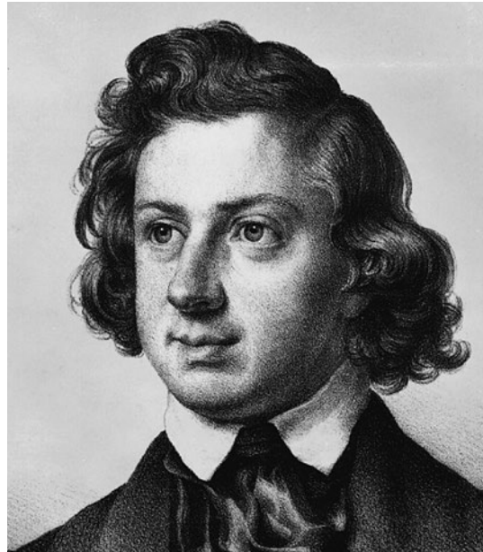
Niels Wilhelm Gade, Kreidelithographie von Georg Weinhold, 1845

Jahr in Leipzig gedruckt erschienen. Mit einer Ausnahme stützte er sich dabei auf Gedichte des Lübeckers Emanuel Geibel, der damals zu den besonders beliebten und oft vertonten deutschen Lyrikern zählte. Nur für das vorletzte, das Herbstlied, das den vierstimmigen Chorsatz durch ein Sopransolo krönt, zog er Verse von Ludwig Tieck heran. Das Gerüst des Zyklus bilden drei Lieder zu den Jahreszeiten: zum Frühling (Nr. 1), Sommer (Nr. 3) und Herbst (Nr. 4), dazwischen steht in typisch romantisch-erotischer Symbolik eine Kon-