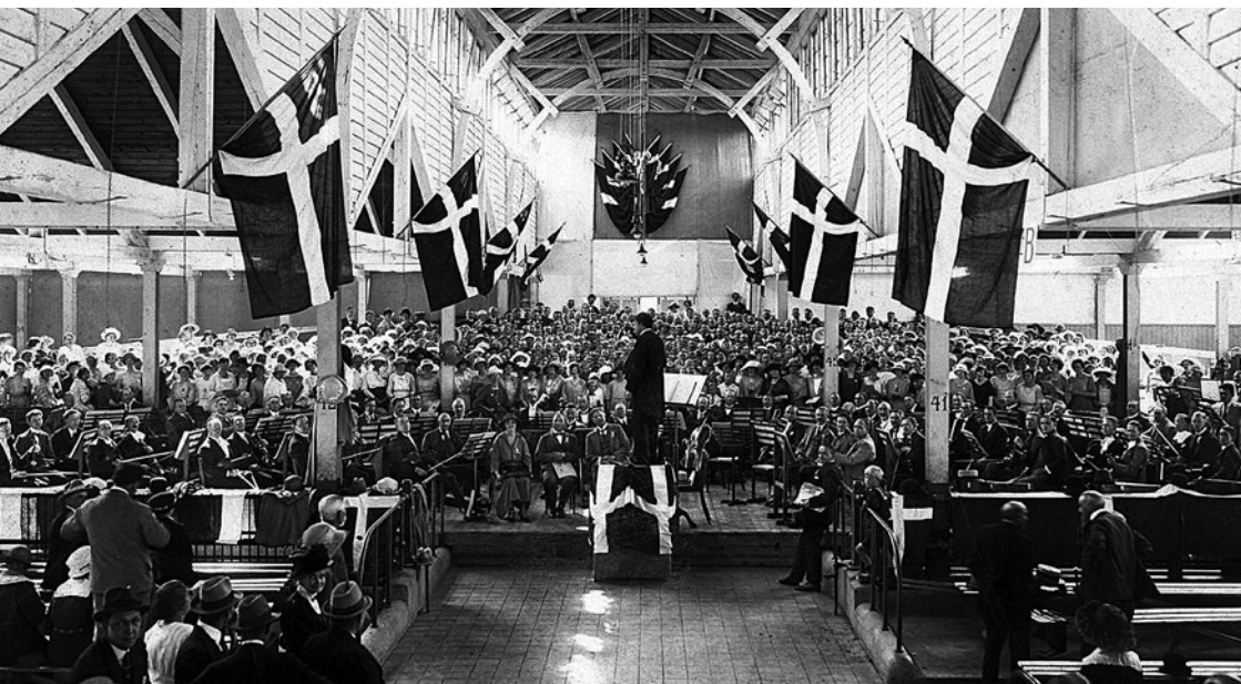
Uraufführung von Carl Niensens Kantate „Frühling auf Fünen“ am 8. Juli 1922, Fotografie, 1922

zert mit A-cappella-Musik aus der Renaissance gehört; und ehe er die Bitte seines Ex-Studenten um Originalwerke erfüllte, beschäftigte er sich mit der Vokalpolyphonie des 16. Jahrhunderts. Er soll