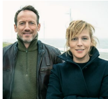
TATORT-TEAM: FALKE & GROSZ

Filmkonzert – Live to projection (FSK 12)