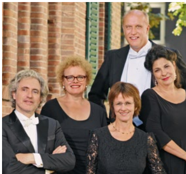
MUSICA ALTA RIPA