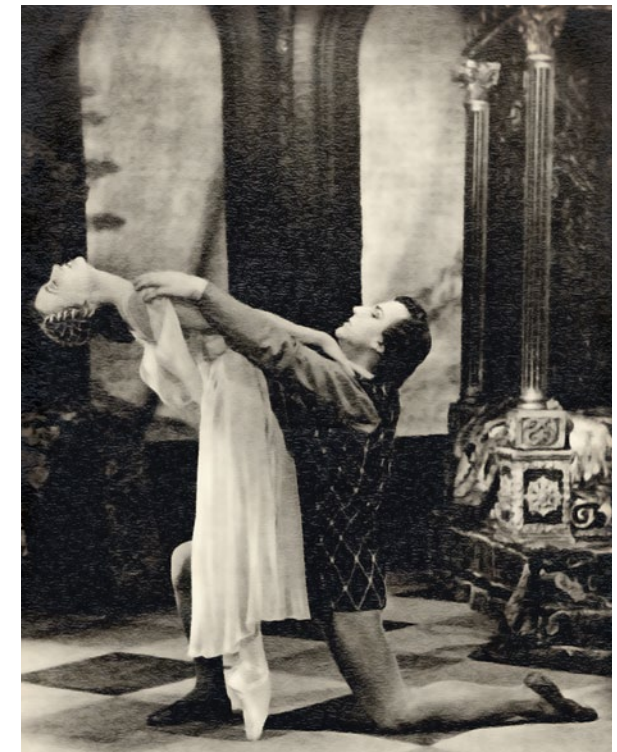
Galina Ulanowa als Julia und Juri Schdanow als Romeo, 1954.

Was entstand hier für eine Musik, die derjenigen von „Peter und der Wolf“ nur um wenige Monate vorausging? Prokofjew hatte seine wilden Jahre hinter sich, er biederte sich durchaus dem Stalinregime an und erhöhte zugleich alle Formen von Machtstreben mit Hilfe seines unnachahmlich freundlichen Zynismus. Mit „Romeo und Julia“ komponierte er ein Ballett, das alle diese biografischen Umstände vereinigte, mehr noch, das musikalisch