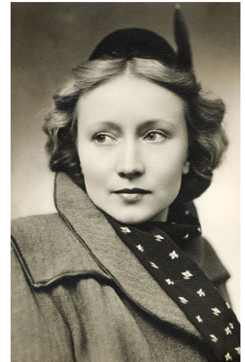
Die russische Tänzerin Galina Ulanowa (1910–1998).

1954 widmeten sich der Choreograf Leonid Lawrowski, der bereits die Uraufführung von Prokofjews Ballett „Romeo und Julia“ betreut hatte, und der Regisseur Lew Arnschtam (er drehte u. a. den Film „Fünf Tage – fünf Nächte“, für den Schostakowitsch die Filmmusik komponierte) einem Projekt, welches das Ballett „Romeo und Julia“ aus dem Theater herausholte und in eine eindrucksvolle natürliche Umgebung stellte. Es tanzten Galina Ulanowa und Juri Schdanow in den Hauptrollen sowie das Ballett des Bolschoi-Theaters. Gedreht wurde mit großem Aufwand an Freiluftschauplätzen am Schwarzen Meer. Der Film erhielt 1955 auf dem Internationalen Filmfestival in Cannes den „Prix du film lyrique“.