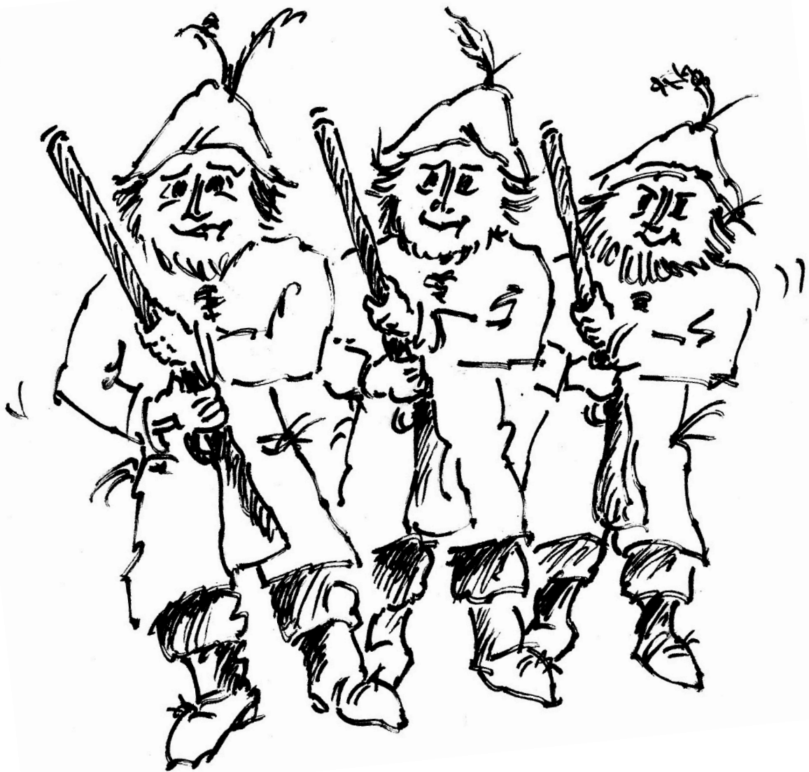
Illustration: ©Wolfgang Reinke