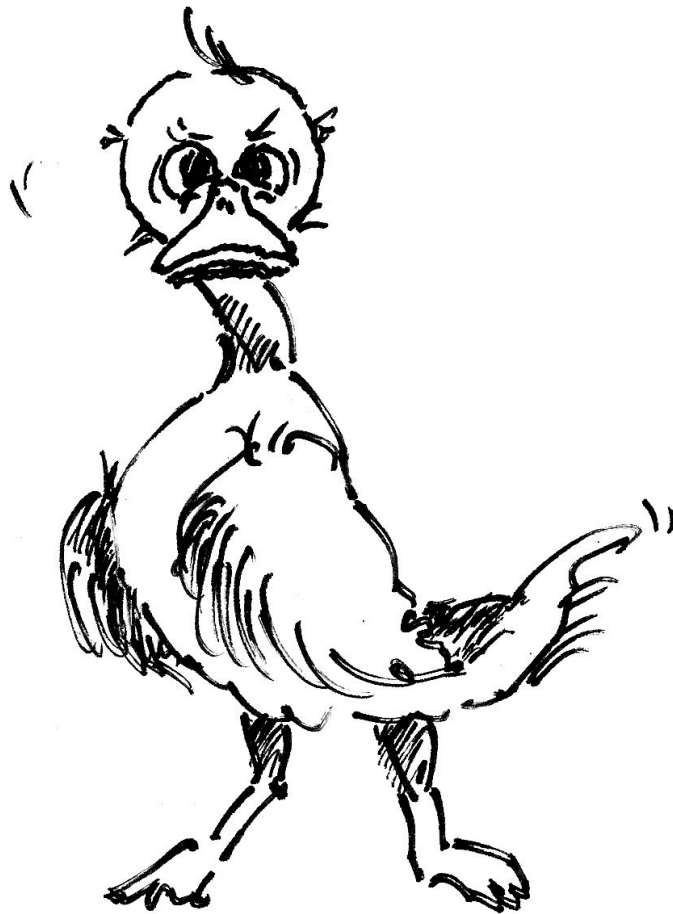
Illustration: ©Wolfgang Reinke