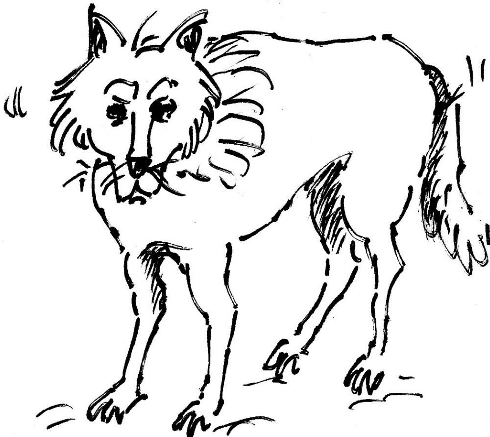
Illustration: ©Wolfgang Reinke