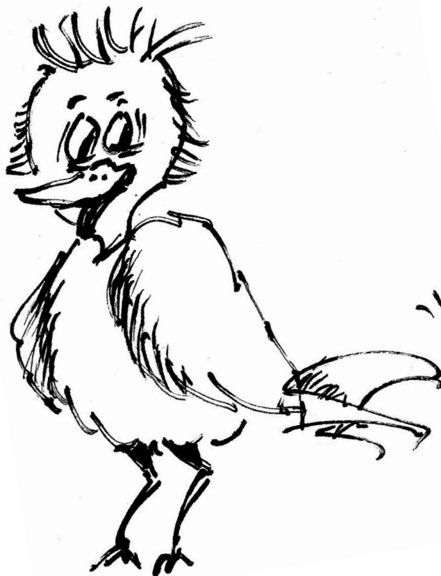
Illustration: ©Wolfgang Reinke