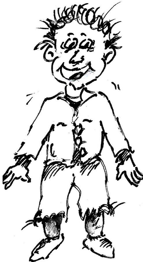
Illustration: ©Wolfgang Reinke