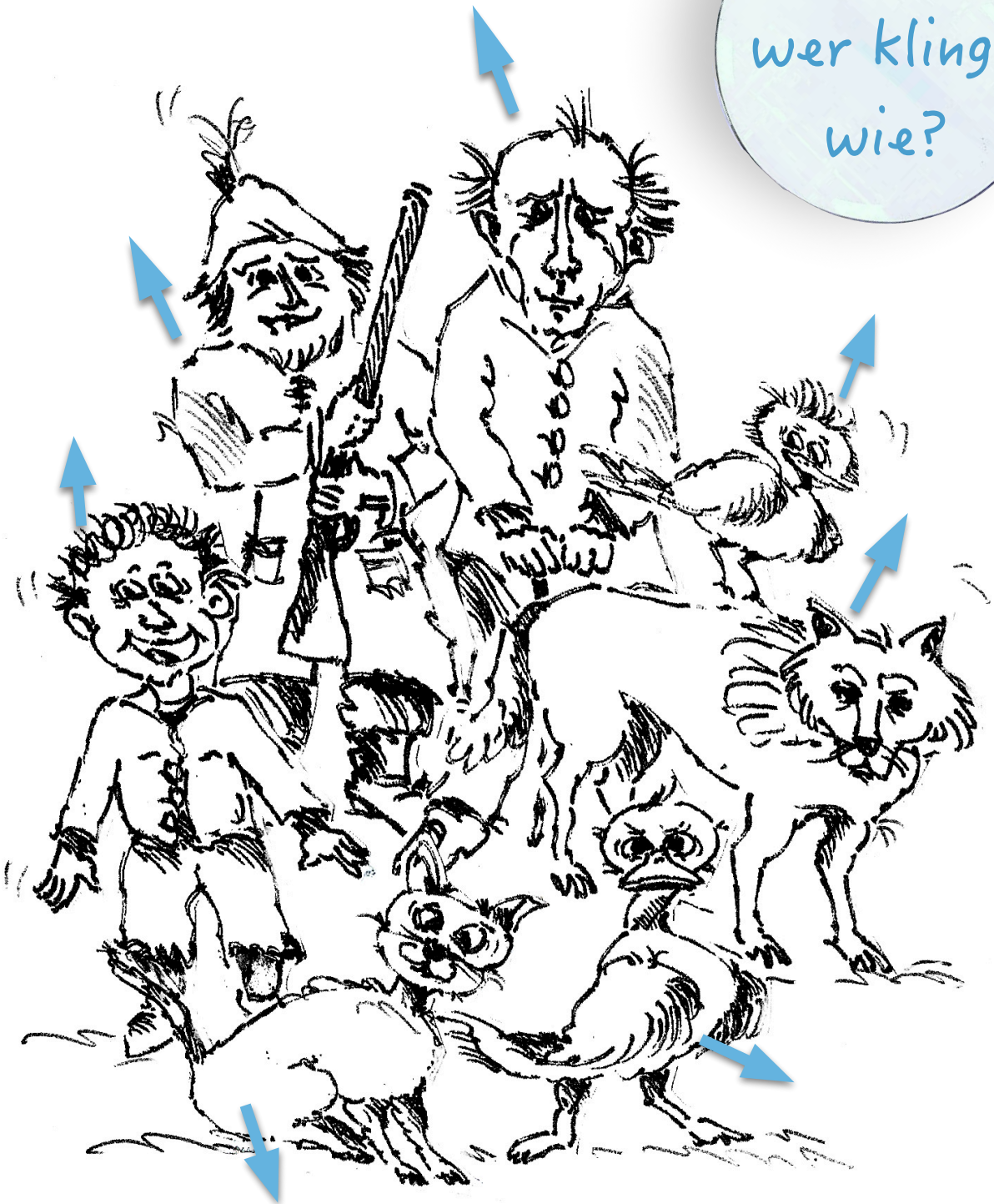
Illustration: © Wolfgang Reinke

Wenn du das Konzert und Maltes musikalische Ermittlungen detektivisch genau verfolgt hast, weißt du als Orchester-Detektiv ganz bestimmt, welches Instrument Prokofjew für welche Figur ausgesucht hat. Notiere die Instrumente neben jeder Figur (Pfeil), bevor du diese Ermittlungsakte schließt!