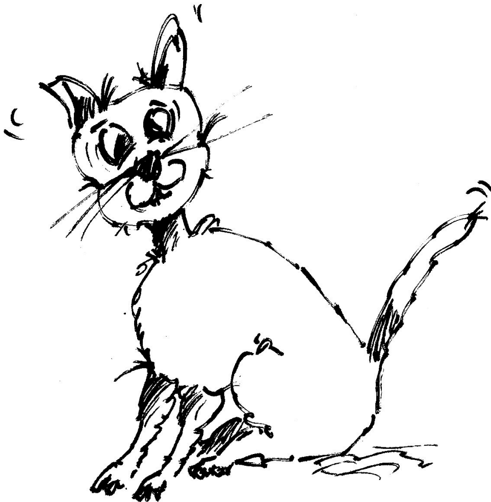
Illustration: ©Wolfgang Reinke