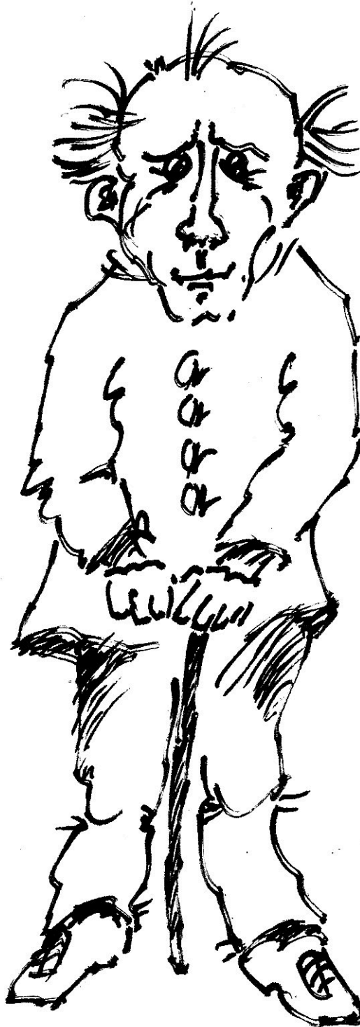
Illustration: ©Wolfgang Reinke