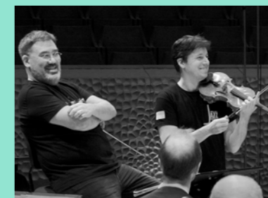
Alan Gilbert und Joshua Bell

In die Saison 2023/24 startet das NDR Elbphilharmonie Orchester unter Chefdirigent Alan Gilbert gemeinsam mit Joshua Bell ganz „elementar“: Der Artist in Residence bringt eine Suite für Violine und Orchester zur Uraufführung, die er bei fünf amerikanischen Komponist*innen in Auftrag gegeben hat. Sie haben sich den fünf Elementen (Erde, Wasser, Feuer, Luft, Äther) gewidmet, in denen sich die Wandlungsprozesse alles Lebendigen spiegeln – ein Gedanke, der das ganze Programm bestimmt: In seinen „Métales“ unterwarf Dutilleux jeweils „die Grundidee einer Reihe von Abwandlungen“. Und Strawinskys Skandal-Klassiker „Le sacre du printemps“ beschreibt in explosiven Klängen jene Urkräfte des Frühlings, die die Natur jedes Jahr aufs Neue verändern.