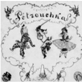
Alexandre Benois: Entwurf für ein Plakat oder Programmheft zu „Petruschka“ (1948)