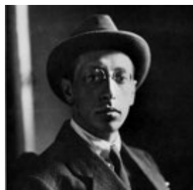
Igor Stravinsky (1913)

Den zentralen Figuren seiner Geschichte ordnete Strawinsky gut wiedererkennbare Klänge oder Motive zu: Petruschka wird charakterisiert durch zwei Akkorde, die im Abstand einer übermäßigen Quarte stehen – des sogenannten Tritonus oder „Diabolus in musica“. Dieser „Teufel in der Musik“ symbolisiert seit jeher das Diabolische, Düstere, Unheimliche –