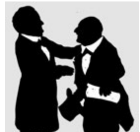
Bruckner und Wagner. Karikatur von Otto Böhler