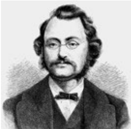
Max Bruch (Holzstich um 1880)