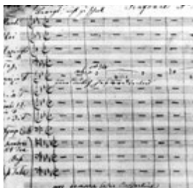
Bruckners eigenhändige Partitur der Vierten Sinfonie, Beginn des 1. Satzes mit dem Hornruf