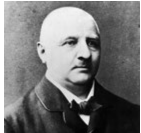
Anton Bruckner (1880)

„Bruckner ist der Schubert unserer Zeit. Es ist ein solcher Strom von Empfindungen in seinem Werke, und eine Idee drängt so die andere, daß man den Reichtum seines Geistes wahrhaft bewundern muß“, lautete es in einer Rezension nach der Uraufführung von Bruckners Vierter im Februar 1881 in Wien. Das Urteil liefert eine mögliche Antwort auf die Frage nach dem „Romantischen“: Als Nachfolger Schuberts, dem Inbegriff musikalischer Romantik, wäre Bruckner insofern zunächst nach kompositorischen Kriterien als „Romantiker“ einzustufen. Der Vergleich zu Schubert taugt immer dann, wenn der Gegensatz zur