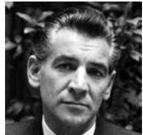
Leonard Bernstein (1959)

Wer sich auf die Suche nach dem Ursprung originär amerikanischer Musik machen will, starte am besten auf dem New Yorker Broadway. Als Sehnsuchtsziel europäischer Auswanderer und „melting pot“ verschiedenster Stile und Genres wurde er um 1920 gleichsam zum Ort, an dem Amerika seine eigene dramatische und musikalische Identität fand. In den „Golden Twenties“ löste die jazz-inspirierte Revue am Broadway die noch europäisch geprägte „Operetta“ ab, bald überflügelte die „Musical Comedy“ beide Genres. Eine neue Generation von Komponisten und Librettisten um George & Ira Gershwin, Irving Berlin und Jerome Kern eroberte den Theatre District. Das Broadway-Musical wurde, so konstatierte 1956 kein Geringerer als Leonard Bernstein, zur „Kunstform, die amerikanischen Wurzeln entspringt, die unserer Sprache, unseren moralischen Einstellungen, unserem Zeitgefühl, unserer Art von Humor entspricht.“ Indes, so wusste auch Bernstein, taugte das Musical in den Augen anspruchsvoller Kritiker nicht als Aushängeschild „ernsthafter“, der europäischen Oper gleichzustellender „Hochkultur“. Hier also war noch Platz und Potenzial, Neues zu schaffen! „Wir befinden uns in einer Situation, die ungefähr der des volkstümlichen musikalischen Theaters in Deutschland kurz vor Mozart entspricht“, so Bernstein weiter. „Damals, im Jahre 1750, war die große Attraktion das ‚Singspiel‘, was nichts anderes war als das ‚Annie Get Your Gun‘ jener Tage ... Nur durch den Genius Mozart wurde aus dem