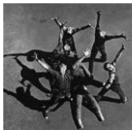
Tanzszene aus dem Film „West Side Story“ (1960)

Leonard Bernstein lebte in seinem künstlerischen Schaffen wie kaum ein zweiter die amerikanische „Cando“-Haltung vor. Stets strebte er danach, die Grenzen zwischen den Stilen und Genres produktiv aufzuweichen, in der Meinung, darin auch eine Antwort auf die Frage zu finden, was genau „Amerikanische Musik“ sei. Sein Zeitgenosse Samuel Barber ging einen anderen Weg. Er machte kein Geheimnis aus seiner eher nostalgischen Einstellung. Barber interessierte sich weder außergewöhnlich viel für Jazz und Musical, noch unterwarf er sich mit seiner Musik dem emphatischen