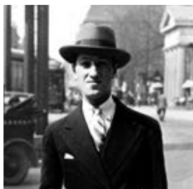
George Gershwin in Berlin (1928)