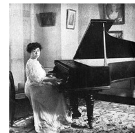
Marguerite Long, Pianistin der Uraufführung von Ravels Klavierkonzert G-Dur

Im Gegenteil handelt es sich – so Ravel – um ein „Konzert im wahrsten Sinne des Wortes. Darunter verstehe ich, dass es im Geiste der Konzerte Mozarts und Saint-Saëns‘ geschrieben ist. Meiner Meinung nach muss die Musik eines Konzerts leicht und brillant und nicht auf Tiefsinn und dramatische Wirkungen bedacht sein ... Zuerst hatte ich gedacht, mein Konzert als ‚divertissement‘ zu bezeichnen...“ Dieser Kommentar ist nun geradezu repräsentativ für Ravels grundsätzliche kompositorische Ästhetik. Einem Komponisten, der gegen Beethoven oder Brahms zeitlebens Vorbehalte hatte, musste jeder Anflug von komplizierter, „schwerer“ motivischer Arbeit, die allzu verdächtig nach Gewolltem statt Intuitivem roch, suspekt erscheinen. „Es gibt eigentlich nur zwei Arten von Musik: die eine gefällt und die andere langweilt“, war Ravels Überzeugung. Damit nun sein G-Dur-Klavierkonzert nicht etwa zur letzteren Kategorie gezählt werden möge, absorbierte Ravel hier gleich ein ganzes Konglomerat verschiedenster Idiome in seiner Tonsprache: Ein bisschen Jazz, ein bisschen Strawinsky oder Debussy, ein paar baskische oder spanische, auch „exotische“ Melodien, das alles eingefügt in eine geradezu klassische Form bei nicht allzu chromatisch befrachteter, stets ungewöhnlicher Harmonik sowie einer meisterhaften Instrumentation mit virtuosem Anspruch an