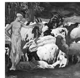
Bühnenbildentwurf von Léon Bakst für „Daphnis et Chloé“