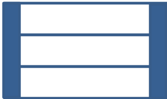
Abbildung 1: Seitenteil

Drei 31,8 cm lange Stücke der Bodendielen untereinander anordnen und mit zwei der 36 cm langen Konstruktionshölzer verbinden. Achte darauf, dass die Konstruktionshölzer außen bündig mit den Terrassendielen abschließen.