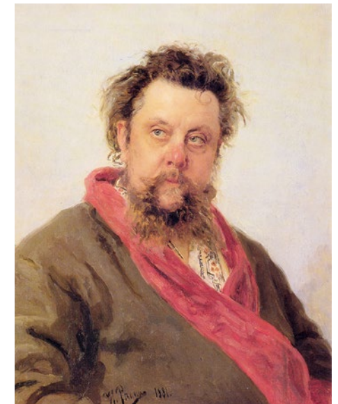
Porträt von Modest Mussorgsky, gemalt von Ilja Repin, 1881.

Ende der 1850er Jahre hatte Mussorgsky sich der später als das „Mächtige Häuflein“ bekannt gewordenen Gruppe angeschlossen und wollte gemeinsam mit Borodin, Balakirew, Cui und Rimsky-Korsakow eine nationalrussische Musiksprache schaffen. Eine sozialkritische Grundhaltung sah er in seiner Kunst allerdings dann wenig durchsetzbar. Der Komponist beneidete die Maler, deren Realismus viel greifbarer war: „Wie traurig ist das! Der Maler versteht es längst, Farben zu mischen,