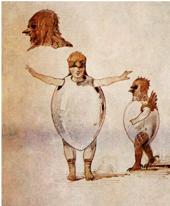
Kostümskizze von Viktor Hartmann zu „Ballett der Küchlein in ihren Eierschalen“, 1871.

tiefe Krise gestürzt. Seiner Musik „à la mémoire d'un ami“ in Form eines vertonten Ausstellungsbesuchs ist dies jedoch nicht anzuhören. Die „Promenade“, die die Bilder einführt und verbindet, bildet ein umrahmendes Motiv, das den Komponisten (oder uns als Zuhörer) bei dem Gang durch die Ausstellung darstellt. Manchmal ist er in Gedanken versunken, mal schaut er überrascht, verwirrt, dreht sich um, wirft den Blick zurück. Auf dem ersten Bild begegnet uns „Gnomus“, ein kleiner Zwerg, der linkisch umhergeht. Diese merkwürdige Begegnung mit dem kleinen Männlein vertont Mussorgsky mit einem hin und her wankenden Achtel- sowie einem hinkenden Synkopenmotiv. Oftmals assoziieren die Bilder die menschliche Stimme. „Bydlo“, das Bild eines schwerfälligen Ochsenkarren, und das Bild „Il vecchio castello“, das nicht das alte