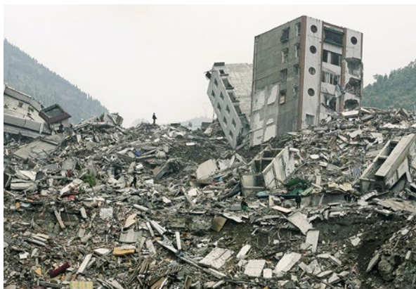
Foto aus der Provinz Sichuan nach dem Erdbeben 2008.

Natur: „Die Farben des Donners der Natur, der Leidenschaft der Natur und der Energie der Natur – jeweils vereint mit dem menschlichen Geist.“ Weiter führt er aus, dass für den ersten Satz die Erinnerung an das Erdbeben in Sichuan 2008 das auslösende Moment war. Die auf unterschiedlichste Weise geschlagene Pauke als Soloinstrument dieses Satzes zeige beide Seiten – „die zarte und die explosive Kraft der Natur“. Ausgangspunkt für den zweiten Satz, „Tränen der Natur“, waren für Tan Dun die Fernsehbilder des Tsunamis in Japan: „Ich glaube nach der Brutalität der Natur muss die Trauer der Natur folgen, die Tränen.“ Die Tragödie des Tsunami bringt er durch das melancholische Marimba-Solo zum Ausdruck. Im dritten Satz „tanzt“ die Natur. Er schildert akustisch die Stadt New York nach dem Hurrikan Sandy. „Nach dem Hurrikan Sandy waren alle in Lower Manhattan und noch viele andere ohne Strom, aber New Yorker verlieren nie ihre Energie und Zuversicht“, so der Komponist, der über sein Stück resümiert: „Auch wenn sich alle drei Sätze in diesem Konzert mit Naturkatastrophen in verschiedenen Städten auseinandersetzen, sie alle vereint die Idee, dass der menschliche Geist stark bleibt. Dieses Konzert feiert den menschlichen Geist, der mit der Natur lebt, kämpft und tanzt.“