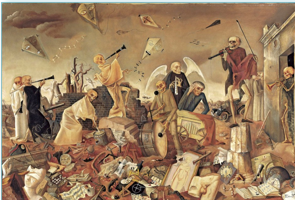
Felix Nussbaum, Triumph des Todes 1944, Felix-Nussbaum-Haus, Osnabrück