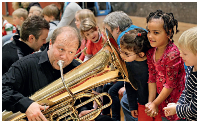
Mit-Mach-Musik mit NDR Brass

„Klasse Musik, Klasse Preis, Klasse Plätze“ heißt es für Schüler und Studenten, die sich mit dem Wahlabonnement (sechs übertragbare Gutscheine à 7 Euro) inspirierende Konzerterlebnisse in der Laeiszhalle gönnen.