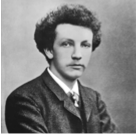
Richard Strauss (1888)