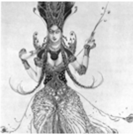
Figurine des Feuervogels von Léon Bakst für die Premiere