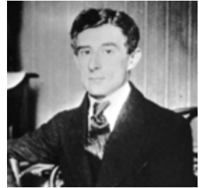
Maurice Ravel (1910)

vollen Orchester, andalusische Arabesken in der Flöte und wiederum an Gitarren erinnernde Tonrepetitionen. Das eigentliche Ständchen oder Morgenlied des im Titel genannten Narren wird im Mittelteil vom Fagott übernommen, dem traditionellen Komiker unter den Orchesterinstrumenten – wobei das „Lied“ denn auch mehr als stockende, von schrillen Kommentaren der hohen Streicher begleitete „Ansprache“ daherkommt. Im weiteren Verlauf erzeugt Ravel, einer der wohl genialsten Virtuosen auf der Klaviatur eines Orchesters, derart schillernde Klänge und musikalische Farben, dass man gar nicht glauben mag, dass das Stück – wie so viele von Ravels Werken – eigentlich für Klavier geschrieben wurde.