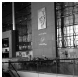
An die Herkunft Prokofjews aus der ukrainischen Oblast Donezk erinnerte eine Tafel in der Wartehalle des 2011 neu eröffneten, heute durch den Krieg zerstörten Flughafens „Sergej Prokofjew“ in Donezk

Parallel zur Fünften skizzierte Prokofjew in den Jahren 1944/45 bereits seine Sinfonie Nr. 6 es-Moll, die er allerdings erst im Februar 1947 fertigstellen konnte. Anders als im Vorgängerwerk dominieren in ihr die tragischen Töne. 1981 drückte Prokofjews sowjetische Biografin Natalia Pawlowna Sawkina das so aus: „Die Sinfonie nimmt in der dramatischen Gestaltung scharfer Kontraste und in den düsteren Kampfepisoden deutlich auf Ereignisse des Krieges Bezug. Ein besonders beeindruckendes Bild des Werkes stellt die erhabene Trauerprozession im Mittelteil des ersten Satzes (Allegro moderato) dar. Drohende Bilder des