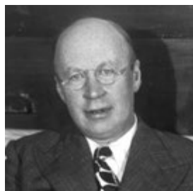
Sergej Prokofjew (1945)