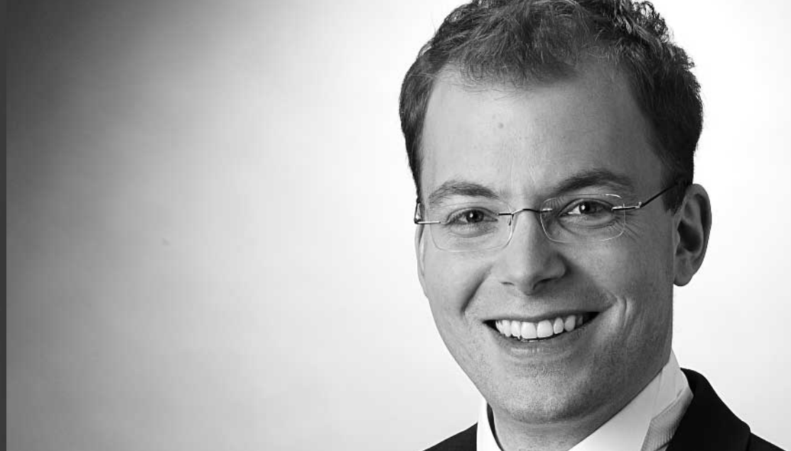
ROLF BECK NDR Orchester und Chor

Ich begrüße Sie herzlich zur neuen Spielzeit und wünsche Ihnen viele anregende Hörerlebnisse!