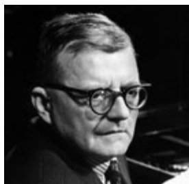
Dmitrij Schostakowitsch (um 1960)

Hören Sie doch meine Musik, da ist alles gesagt.