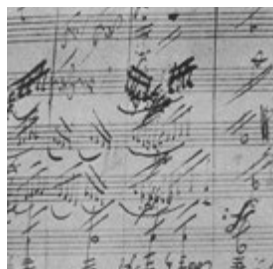
Ausschnitt aus einer eigenhändigen Partiturseite aus Beethovens Siebter